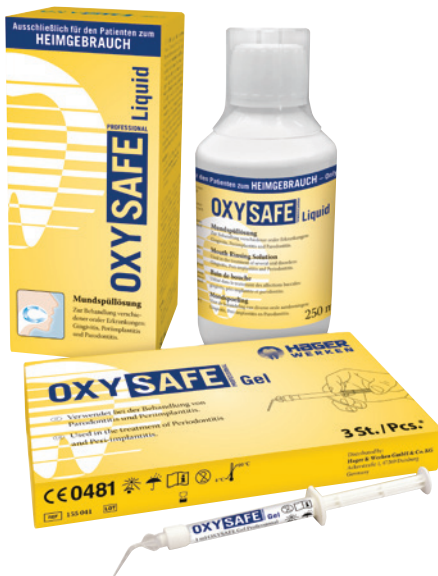
Abb. 1: OXYSAFE Professional für die UPT (Hager & Werken, Duisburg).

Vertrauen der Patienten in die Therapieansätze der Praxis gestärkt. Gute und rasche Heilungserfolge sind Motivationsverstärker sowohl für den Behandler als auch für den Patienten. Prophylaxepraxen, die mit individuellen, innovativen und professionellen Konzepten arbeiten, sollten ihre Patienten über die Möglichkeit einer aktiven Sauerstofftherapie mit OXYSAFE Professional, in Verbindung mit einer Parodontitis- und/oder Periimplantitiserkrankung, aufklären und informieren. Patienten mit Allgemeinerkrankungen wie z.B. Diabetes mellitus, bei denen eine gestörte Wundheilung den Therapieverlauf erschweren kann, profitieren von der Applikation und dem anschließenden häuslichen Spülen mit OXYSAFE Professional Liquid, ganz ohne Nebenwirkungen. Im Nachgang erleben wir hierdurch viele positive Weiterempfehlungen aus dem Kreis unserer Patienten. Ich arbeite bereits seit einigen Jahren mit OXYSAFE Professional und schätze die einfache, schmerzlose und effiziente Ap-