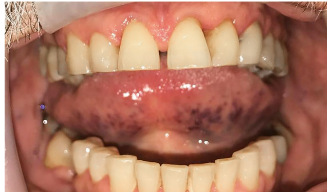
Abb. 2: Situation vor Therapie