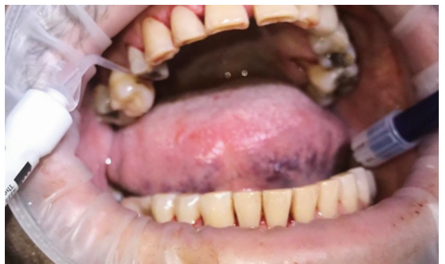
Abb. 4: Erste Applikation des OxySAFE Gels