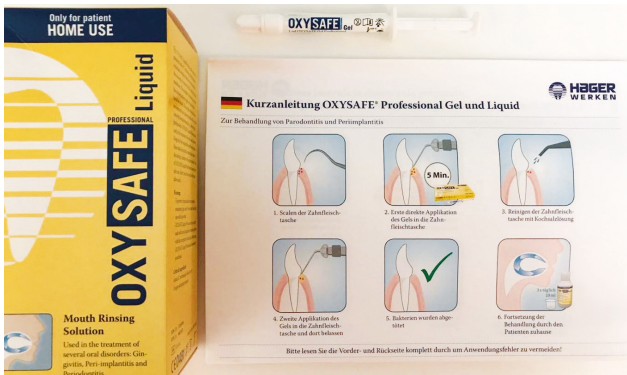
Abb. 1: Das OxySAFE Professional Kit