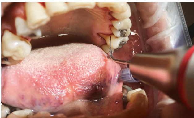
Abb. 3: Reinigung der Taschen