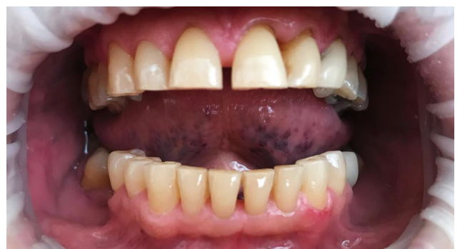
Abb. 6: Klinische Abschlussituation

Für ein dauerhaftes und besseres Therapieergebnis erfolgte die Fortsetzung der Behandlung mit OxySAFE Liquid. Das ist eine Mundspülung, die häuslich direkt nach der Behandlung zweimal täglich, morgens und abends nach dem Zähneputzen zur Nachsorge angewendet wird.