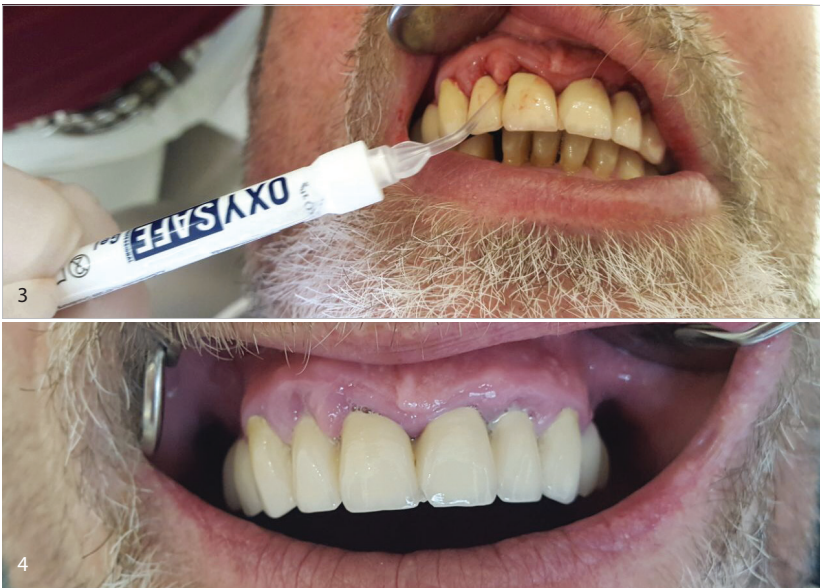
Abb. 3: Applikation des OXYSAFE Gels in situ. Abb. 4: Patientensituation drei Wochen nach Beginn der Sauerstofftherapie mittels OXYSAFE Professional.