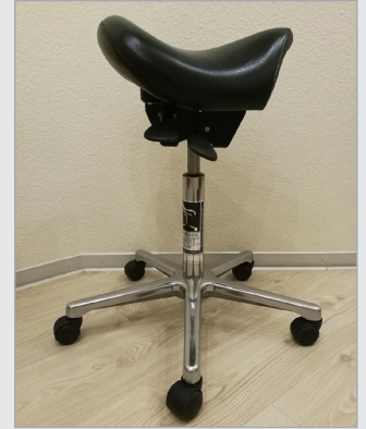
Einzigartige, patentierte Sattelform entspannt Lenden- und Rückenbereich.

Spannungsschmerzen, Verkrampfungen und eine schlechte Körperhaltung gehören endlich der Vergangenheit an. Der Bambach Sattelsitz war für mich und das Praxisteam eine sinnvolle und wertvolle Investition in unsere Gesundheit.