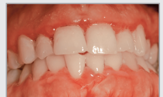
Ausgangssituation November 2019