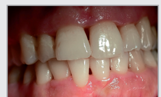
Situ zur Reevaluation Juli 2020