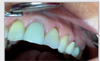
Reizlose Gingiva nach Therapie