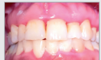
Situation vor der 2. Initialtherapie Februar 2020