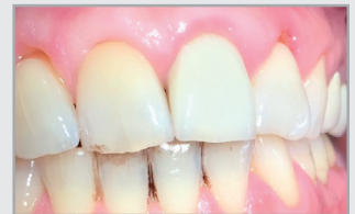
Gereizte Gingiva aufgrund von Rezessionen, keilförmigen Defekten und Kronenrändern

Nach zwei Wochen wurde die Patientin wieder einbestellt, die Gingiva war reizlos, sodass die Zahnhalsfüllungen ohne weiteres gelegt werden konnten.