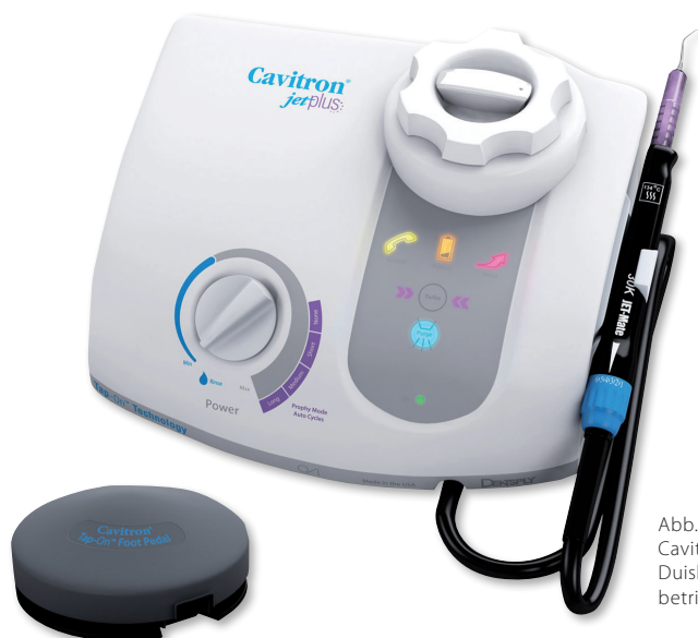
Abb. 2: Das Ultraschallgerät Cavitron von Hager & Werken, Duisburg wird magnetostriktiv betrieben.

Das sind die Vorteile für den Patienten, aber auch ich war von den Vorzügen dieses Gerätes überzeugt. Die Sensibilität, mit der es sich arbeiten ließ, die deutlich geringere Blutungsneigung während der Behandlung, das ermüdungsfreie Arbeiten, da das Gerät sehr ausgewogen in der Hand liegt, und vor allem die sehr gründliche, schonende, aber sehr effektive mechanische Reinigung der Wurzeloberflächen beeindruckten mich. Verbunden mit der Irrigation und Kavitation des Sulcus und der Taschen und dem akustischen Microstreaming war dies genau das, was ich für die erfolgreiche Behandlung meiner Patienten erhofft hatte.