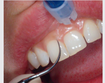
Abb. 1: Die meist runden Spitzen der Inserts beschreiben eine elliptische Form.

Nachdem das piezoelektrische Ultraschallgerät mich nicht überzeugen konnte, probierte ich eine andere Art der maschinellen Reinigung mittels Ultraschall aus. Ich lernte das Cavitron (Abb. 2) kennen, ein Ultraschallgerät, das magnetostriktiv betrieben wird. Elektrische Energie wird innerhalb des Handstücks durch das ferromagnetische Metallbündel am Insert und eine im Handstück verbaute Kupferspule in Magnetostriktion umgewandelt. Diese bringt dann die mechanische Energie an die Spitze des Inserts und versetzt diese so in Bewegung. Das Cavitron wird mit einer Frequenz von 25 – 30 kHz betrieben. Die meist runden Spitzen der Inserts beschreiben eine elliptische Form (Abb. 1). Flache Spitzen der Inserts beschreiben eine ebenfalls elliptische Form.