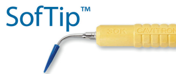
Abb. 3: Die Unterschiede der Cavitron® Inserts.

Die Cavitron SofTip Insert ist hervorragend geeignet für eine zeitsparende und effektive Plaque- und Zahnsteinentfernung an Titanimplantaten und -abutments .