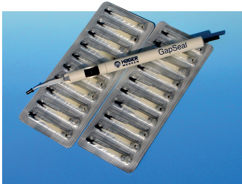
Abb. 3: GapSeal®

GapSeal® wird steril in Blisterpackungen mit zehn Carpuhlen mit je 0,06 ml Inhalt und Applikator geliefert, sodass die Sterilität auch bei Operationen gegeben ist (Abb. 3). Für die Wiederverwendung kann der Applikator re-sterilisiert werden. Es bietet sich an, die Hohlräume so früh wie möglich zu versiegeln, am besten direkt bei der Eingliederung. Nach Einlegen der GapSeal®-Carpuhle in den Applikator und Abnehmen der Verschlusskappe wird GapSeal® durch leichtes Drehen am Transportrad direkt appliziert. Das Auffüllen erfolgt mit Überschuss, damit keine Luftschlüsse entstehen.