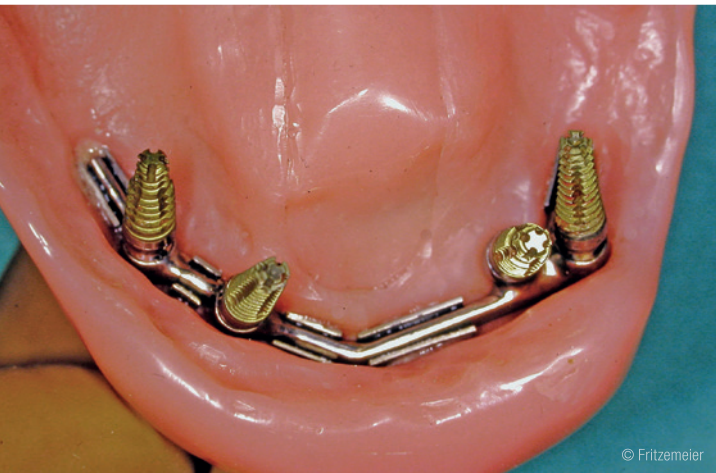
Abb. 2: Schlupfwinkel unter einer Unterkieferprothese, die über einen implantatgetragenen Steg abgestützt ist.

Mundhöhlenflora. Sie werden durch Mikrobewegungen 2 innerhalb der Rekonstruktionen in die Spalten hineingepumpt und zusätzlich über Kapillarkräfte angesogen.