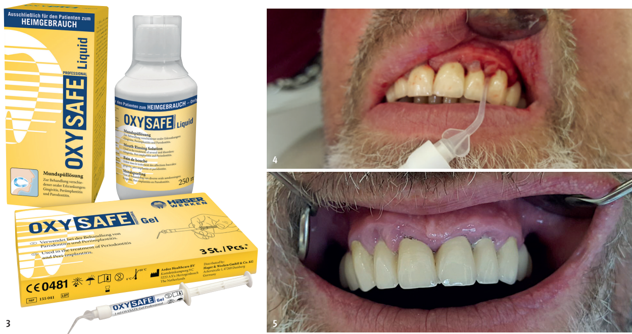
Abb. 3: Sauerstofftherapie mittels OXYSAFE Gel & Liquid (Hager & Werken). Abb. 4: Applikation des OXYSAFE Gels in situ. Abb. 5: Patientensituation drei Wochen nach Beginn der Sauerstofftherapie mittels OXYSAFE Professional.

Tests mittels Entnahme des Sulkusfluids ergab, dass der Patient stark erhöhte Werte bei den anaeroben Bakterien Porphyromonas gingivalis , Campylobacter rectus und Tannerella forsythia nachwies. Die Anwendung mittels Diodenlaser im OK-Frontzahnbereich mit Photodynamischer Therapie verbesserte den Befund kurzfristig. Die Wirkungszeit aller Therapien war jeweils leider nur sehr kurz, die Reinfektion der befallenen Taschen immer wieder festzustellen.