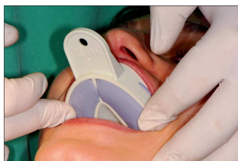
Implantatabdruck Regio 26 bei Zustand nach Implantation vier Monate zuvor