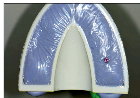
Aufsicht auf die innovative und patentierte Folientechnik