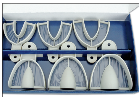
Miratray-Implantatlöffel von Hager & Werken